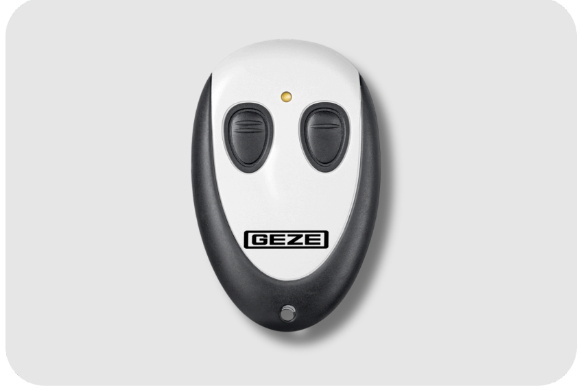
GEZE WTH Telsiz Uzaktan Kumanda