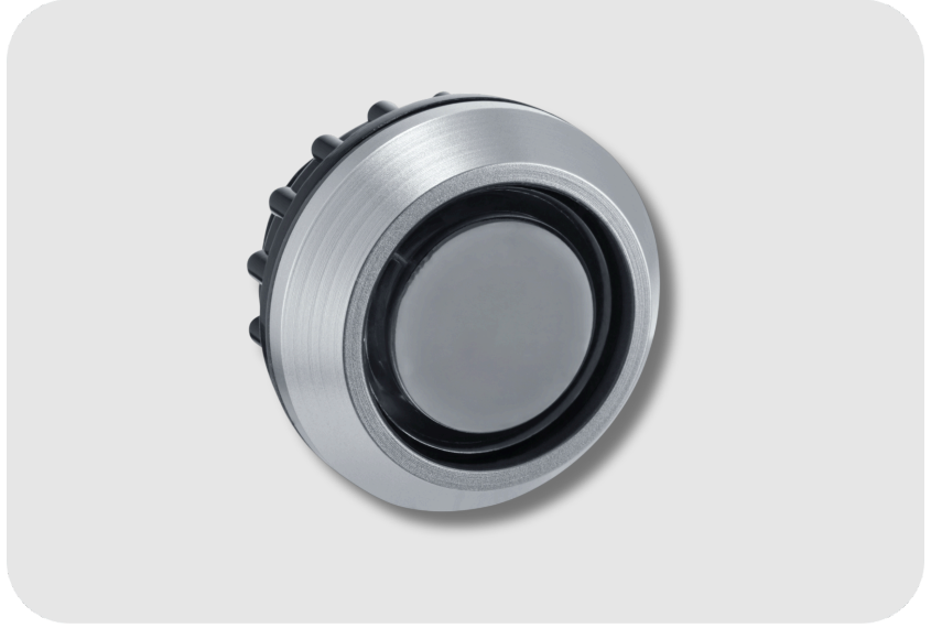
GEZE Mini LED Sensör Butonu