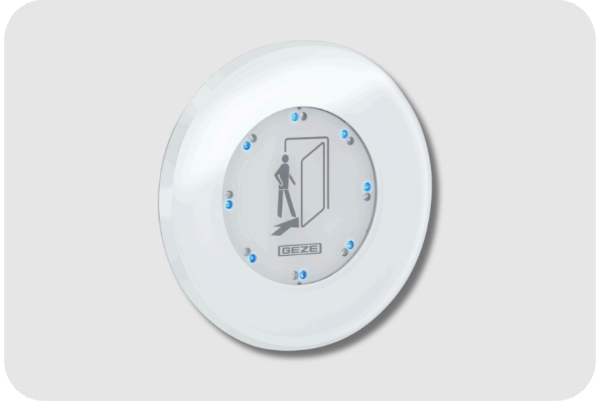
GEZE LED Sensör Butonu