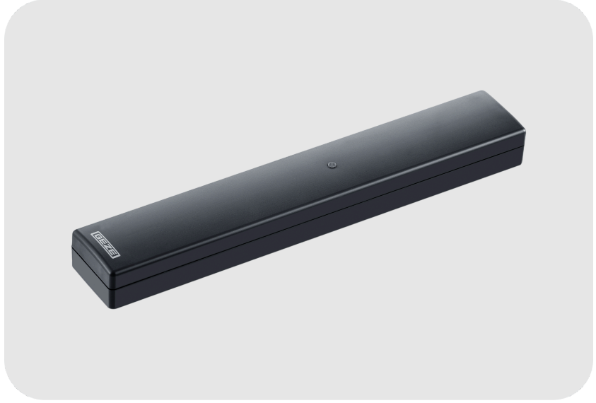
GEZE GC 171 Telsiz Modülü