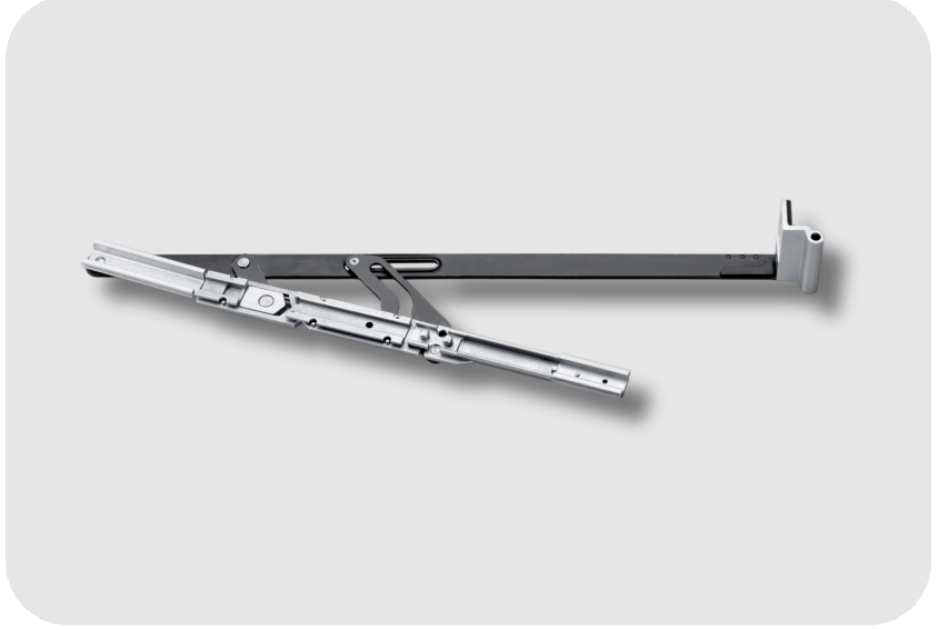
GEZE Büyük ve Ağır Pencerelelerin Manuel Havalandırması İçin Çevirme Kollu Çift Açılım Aksesuar Sistemi