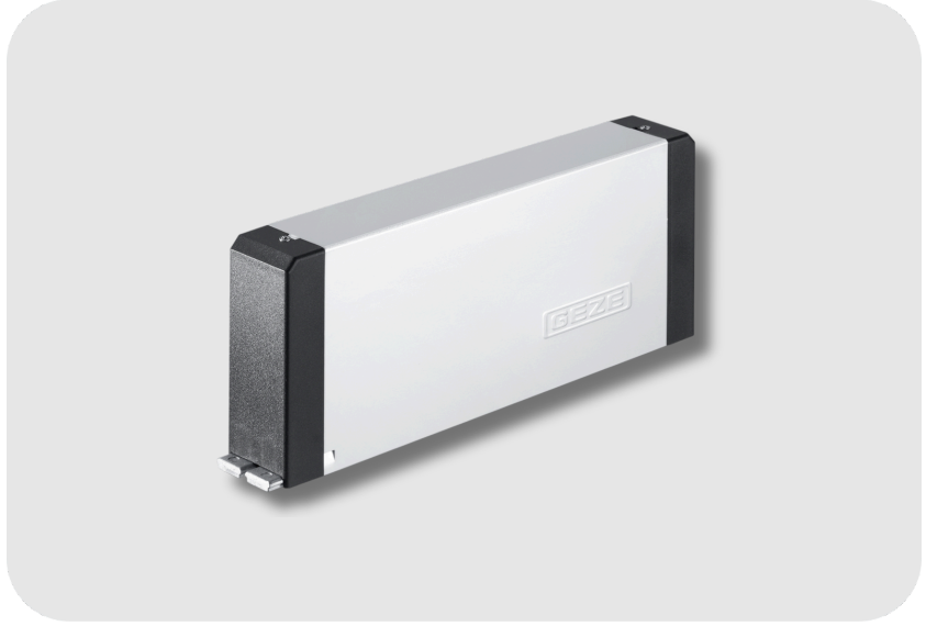
GEZE İnce Tip Çatı Penceresi Mekanizması Otomasyonu İçin Elektrikli Düz Açma Motor