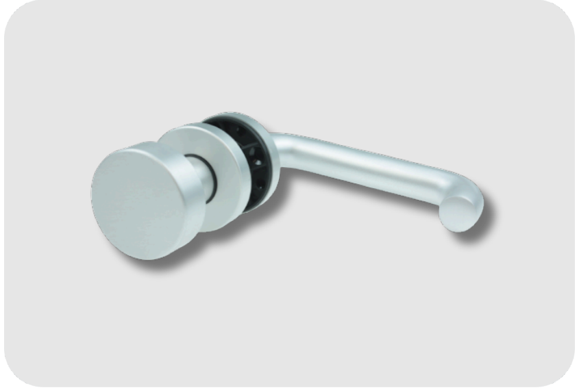
DORMAKABA Junior Office/Rondo Fonksiyonsuz Topuz Kol Cam Kapı Aksesuarı