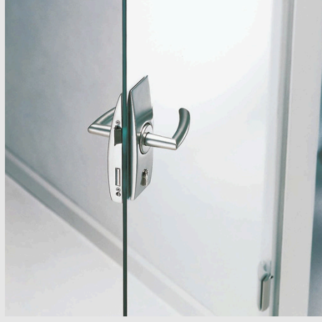
DORMAKABA Arcos Office Kasalı Sistem Seti