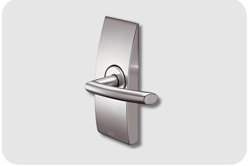
DORMAKABA Arcos Office Kol Cam Kapı Aksesuarı