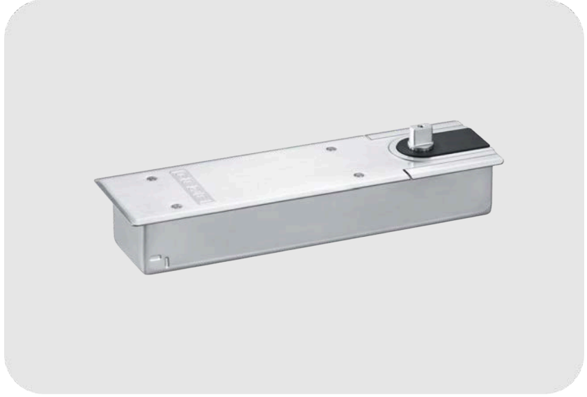
GEZE TS 550 NV F EN 3-6 Zemine Gömme Yer Hidroliđi