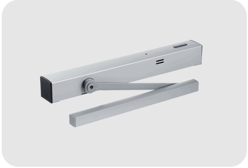
GEZE TS 5000 RFS 3-6 KB Kayar Kollu Tek Kanat Kapı Kapatıcı Hidrolik