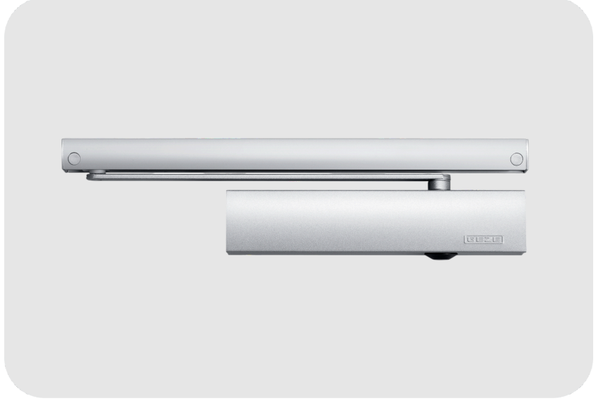
GEZE TS 5000 L Ecline Kayar Kollu Tek Kanat Kapı Kapatıcı