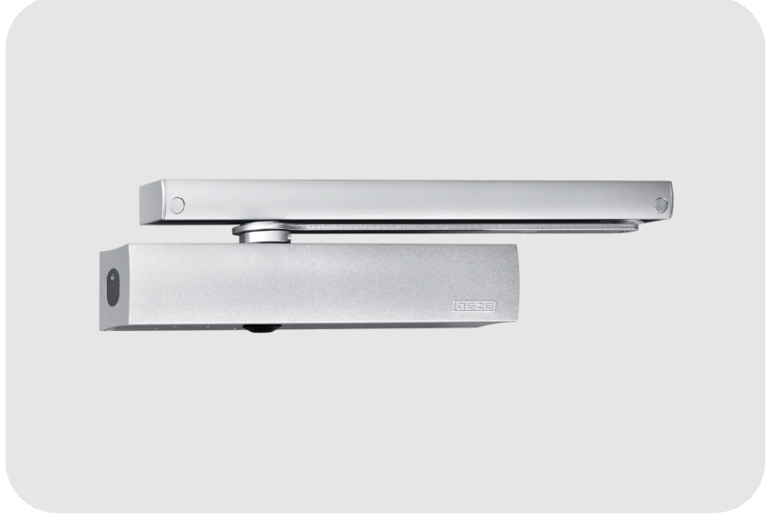
GEZE TS 5000 EFS 3-6 Kayar Kollu Kapı Kapatıcı Hidrolik