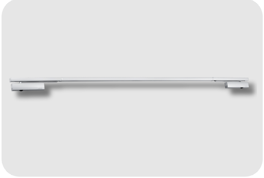
GEZE TS 5000 E-ISM/S Kayar Kollu Kapı Kapatıcı Hidrolik