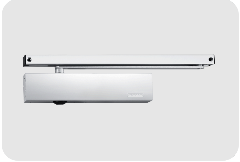
GEZE TS 5000 Kayar Kollu Kapı Kapatıcı Hidrolik