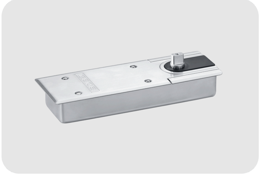
GEZE TS 500 NV Sabitleme Fonksiyonlu Zemine Gömme Yer Hidroliği