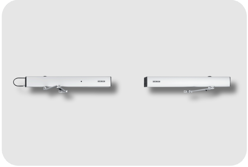
GEZE TS 4000 R-IS Dirsek Kollu Çift Kanat Elektromekanik Sabitlemeli TS 4000 R-IS Sıralamalı Duman Detektörü Bağlantı Merkezi Kapı Kapatıcı Hidrolik