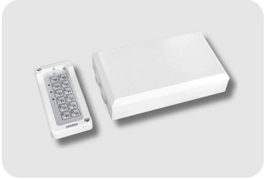
GEZE Dış Alanda Kolay Erişim Kontrolü İçin Işıklılandırılmış Sayısal Şifreli Kilit