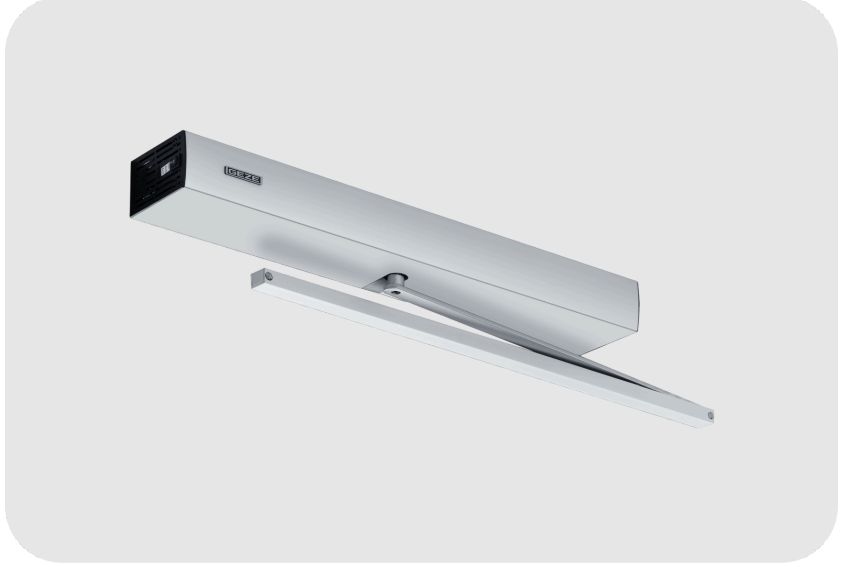
GEZE Slimdrive EMD Invers Otomatik Kapı Motoru