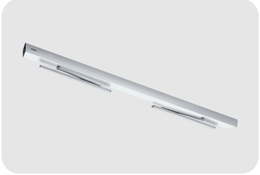
GEZE Slimdrive EMD-F-IS Otomatik Kapı Motoru