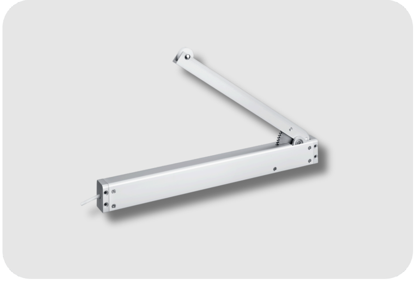
GEZE RWA K 600 T Kapılara Temiz Hava Besleme Sistemi İçin Monte Edilen Katlanır Kollu Motor