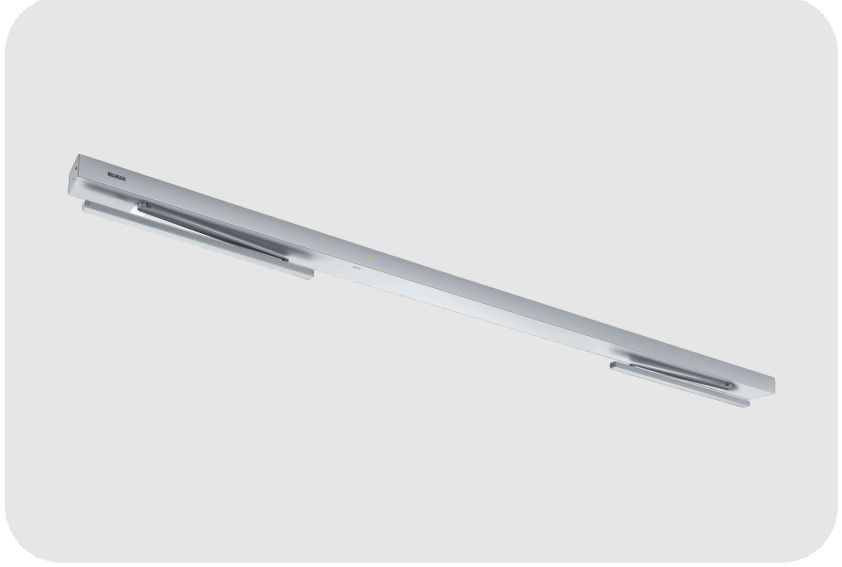
GEZE Powerturn IS/TS Otomatik Kapı Motoru