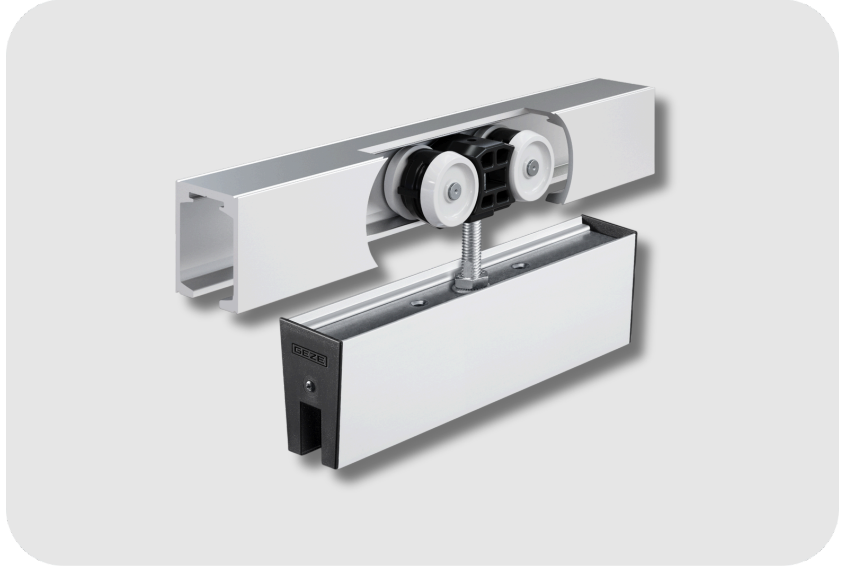
GEZE Perlan Cam Kanatlar ve Tavana Montaj İçin Sürgü Aksamı