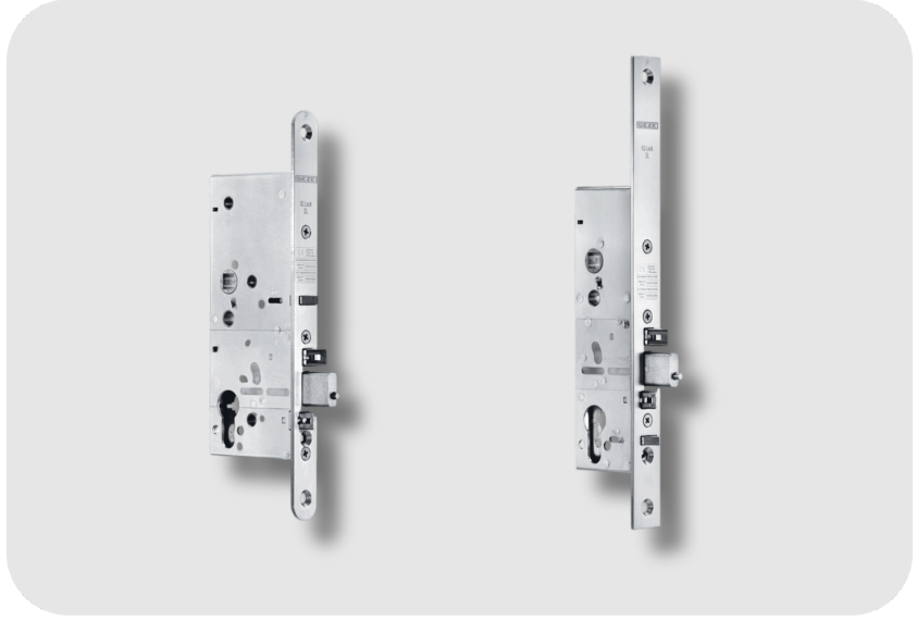
GEZE İki Kanatlı Kapılarda Basit Panik Fonksiyonu İçin Mekanik Panik Kilidi