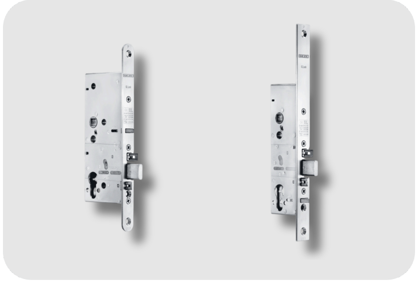
GEZE Tek Kanatlı Kapılarda Basit Panik Durumları İçin Mekanik Panik Fonksiyonu Kilidi