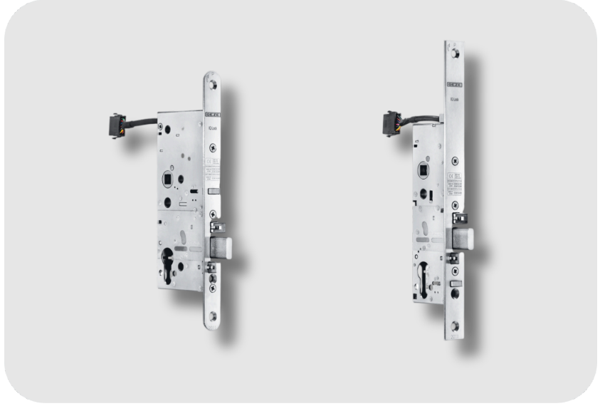
GEZE Tek Kanatlı Kapılarda Erişim Kontrol Sistemi İle Kombinasyon İçin Elektromekanik Kapı Kolu Kilitleme Düzeneği