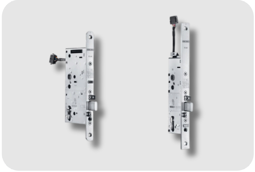
GEZE Tek Kanatlı Kapılarda Açılır Kapı Motorları İle Kombine İçin Elektromekanik Motor Hidroliği