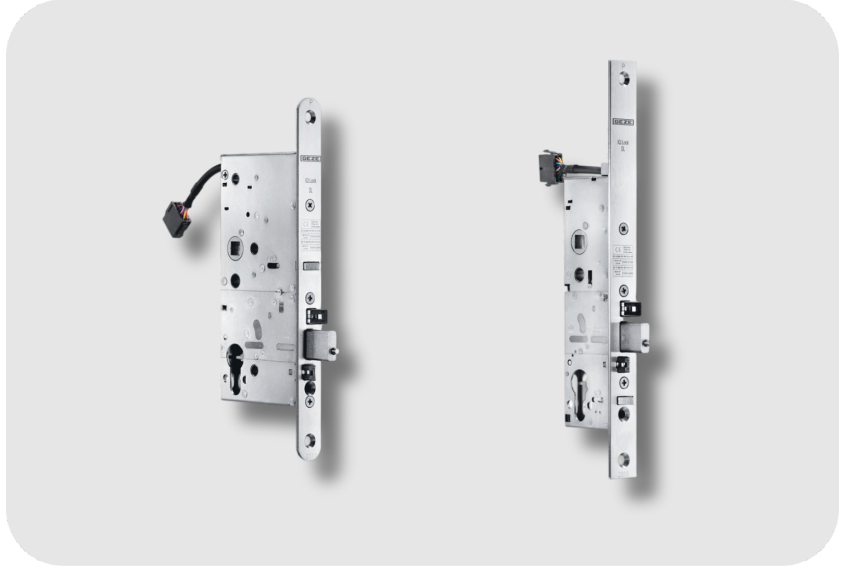
GEZE İki Kanatlı Kapılar İçin Kilit Kontrol Kontaklı Bulunan Mekanik Kontakt Kiliti