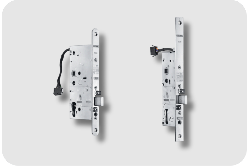
GEZE Tek Kanatlı Kapılar İçin Kilit Kontrol Konağı Bulunan Mekanik Kontak Kilidi