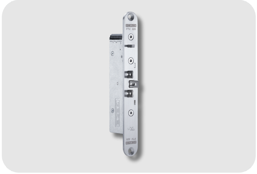
GEZE Kaçış Yolları Üzerindeki Kapılar İçin Kaçış Kapısı Kilit Mekanizması