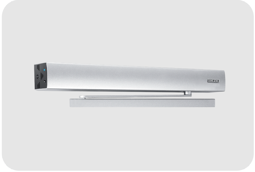
GEZE ECTurn Otomatik Kapı Motoru