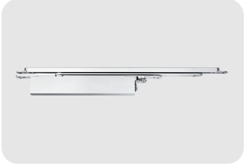
GEZE Boxer P Tek Kanatlı Çift Yöne Açılımlı Kapılar İçin Kapiya Entegre Kapı Kapatıcı Hidrolik