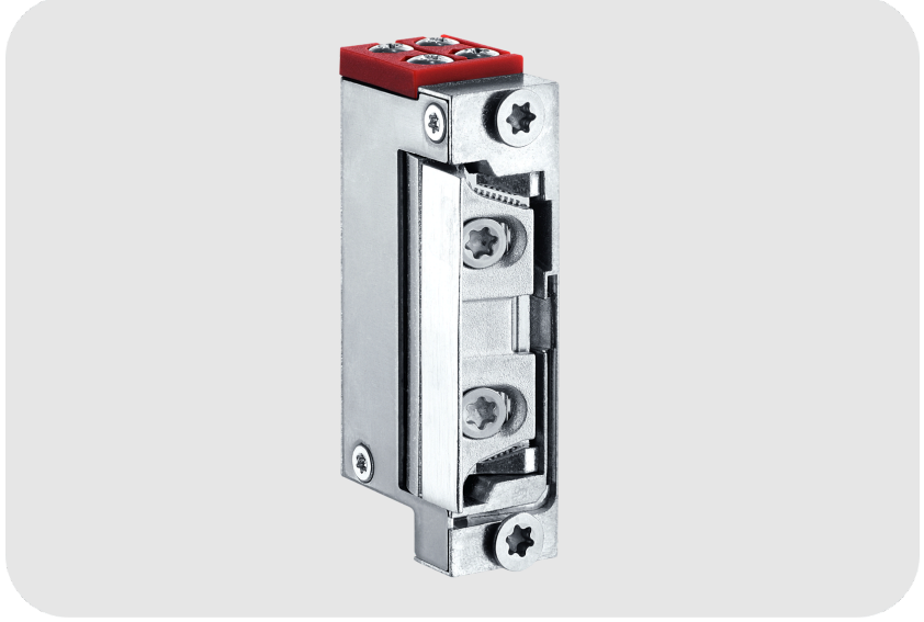
GEZE Kompakt Kapı Açma Mekanizması Temel Ekipmanlı Kapı Otomatığı