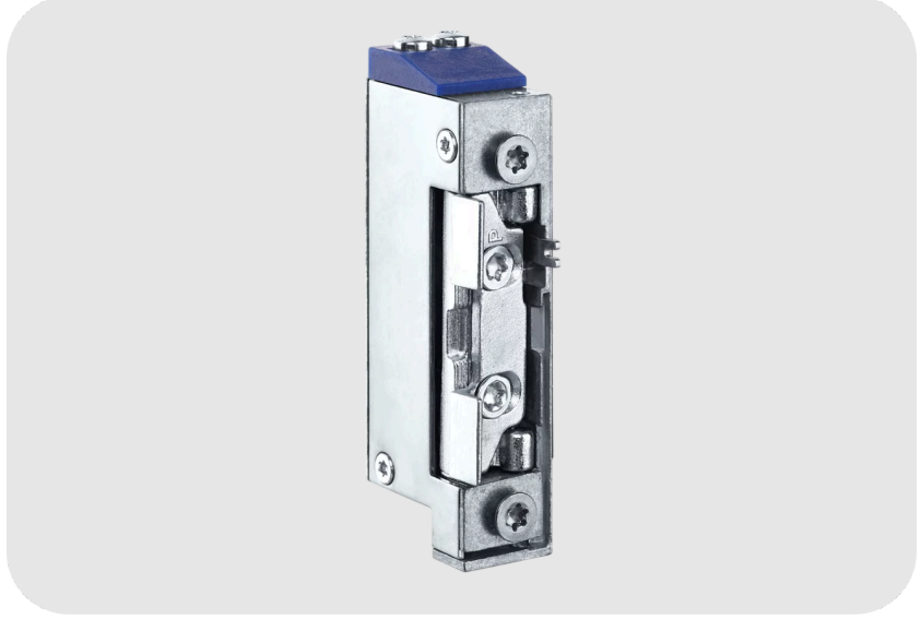
GEZE Vektör Kapı Açma Mekanizması Uzatılmış Kilit Açma Kollu ve Ayar Köşebendinde Geniş Boşluklu Kapı Otomatığı