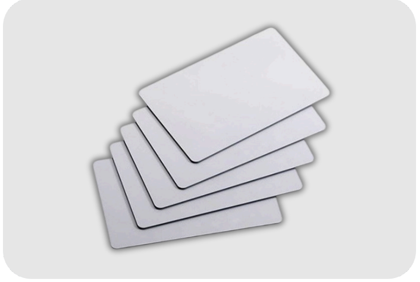
HIKVISION ICS50 Mifare Kart