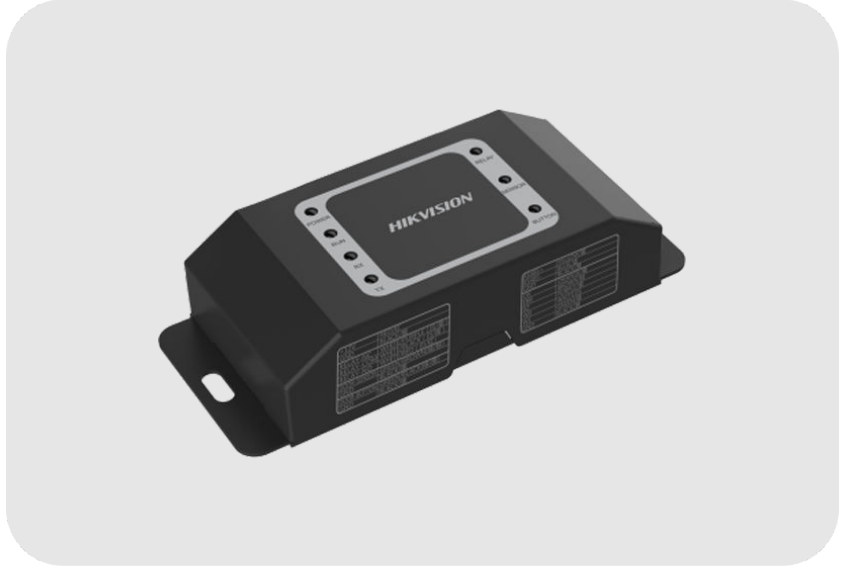
HIKVISION DS-K2M060 Kapı Modülü