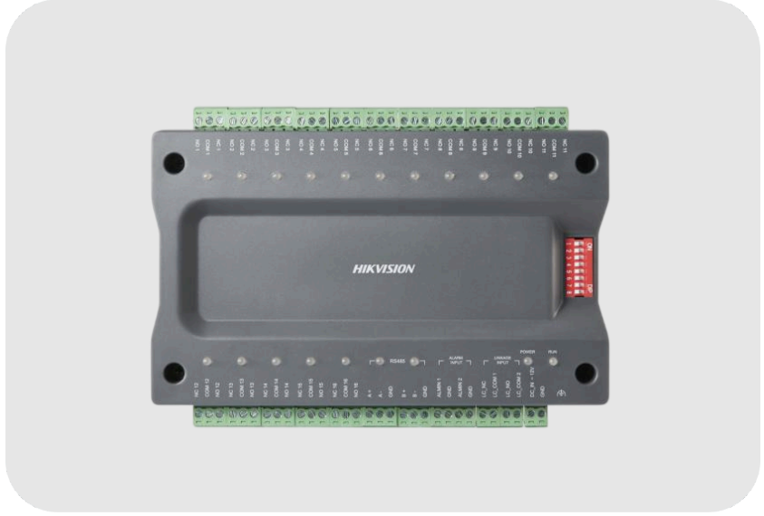
HIKVISION DS-K2M0016A Asansör Kontrol Dağıtıcı Ünite