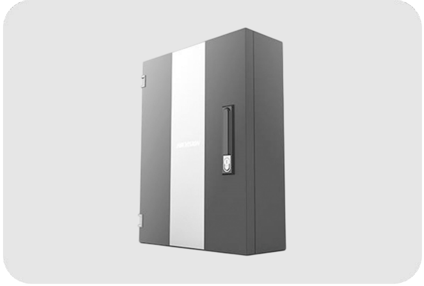
HIKVISION DS-K27M04 Access Geçiş Kontrol Paneli