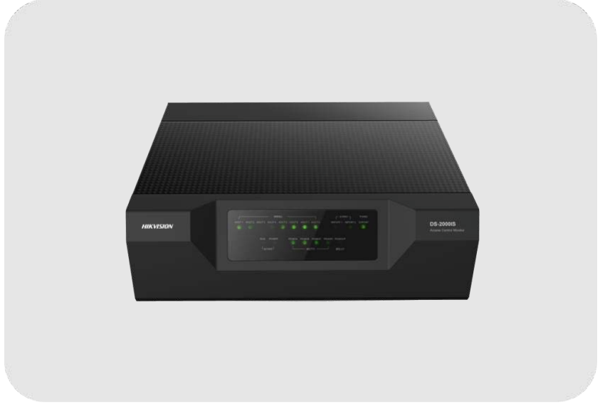
HIKVISION DS-K2700 Master Access Geçiş Kontrol Paneli