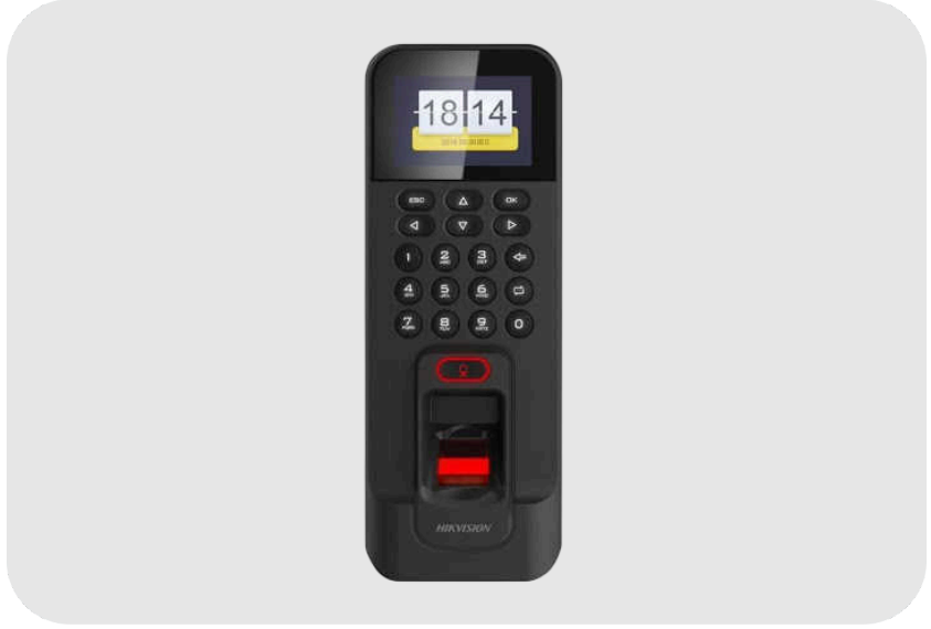
HIKVISION DS-K1T804F Parmak İzi ve Kart Okuyucu