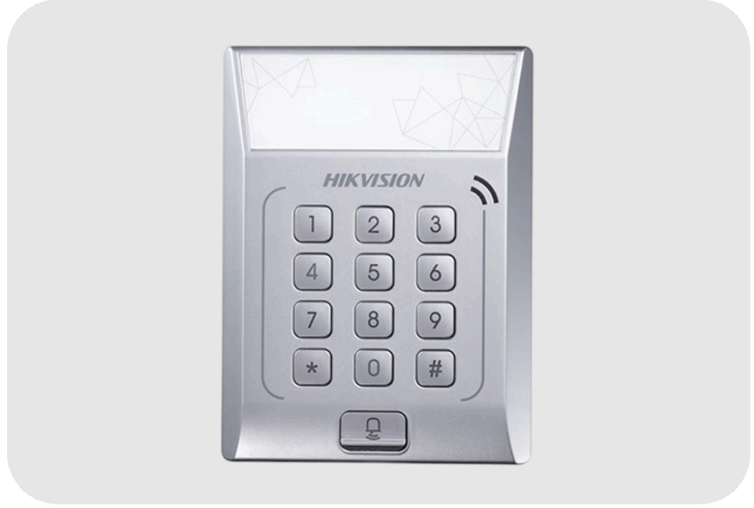
HIKVISION DS-K1T801E Proximity Kart Okuyucu