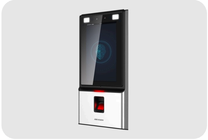
HIKVISION DS-KIT606MF Yüz Tanıma, Parmak İzi ve Kart Okuyucu