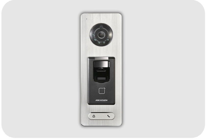
HIKVISION DS-K1T501SF Parmak İzi ve Kart Okuyucu