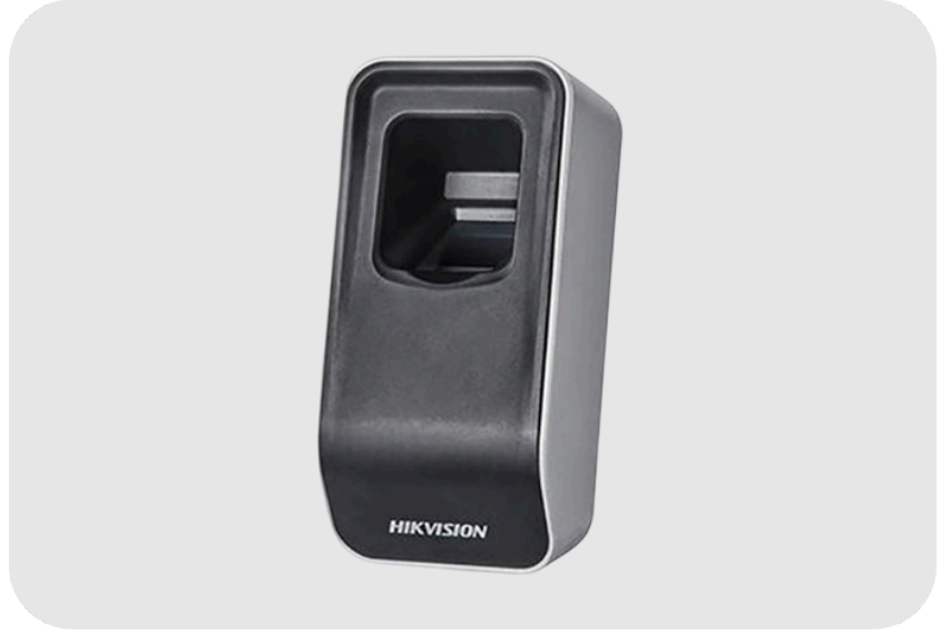
HIKVISION DS-K1F820-F Parmak İzi Tanımlama Cihazı