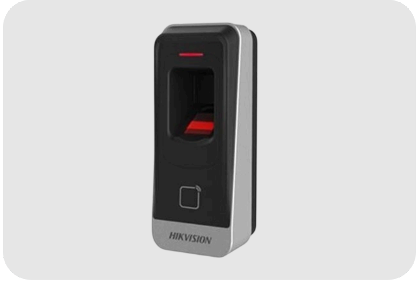
HIKVISION DS-K1201EF Parmak İzi Okuyucu