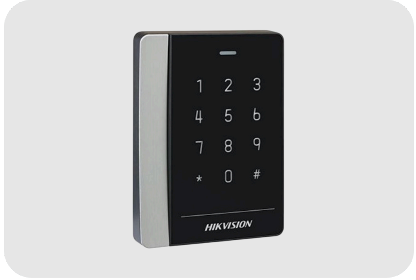
HIKVISION DS-K1102MK Mifare Kart Okuyucu