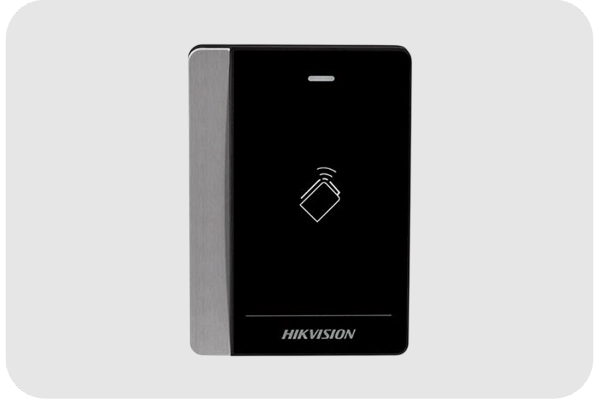
HIKVISION DS-K1102M Mifare Kart Okuyucu