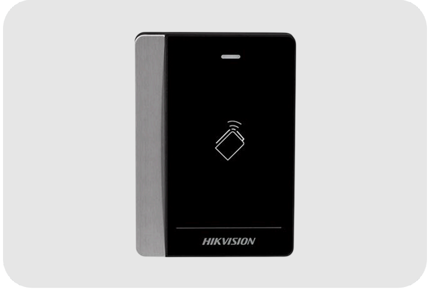
HIKVISION DS-K1102E Proximity Kart Okuyucu