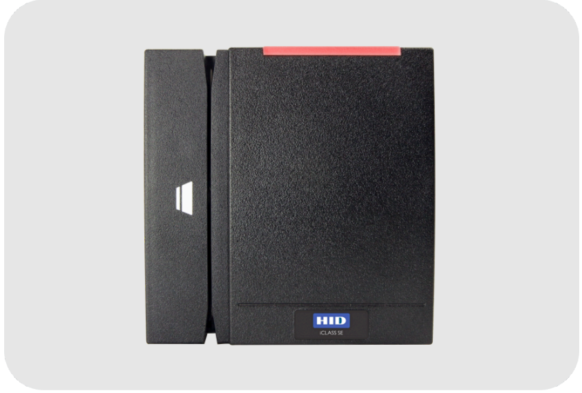
ASSA ABLOY HID RM40 iCLASS SE™ RFID Okuyucu 13,56 Mhz