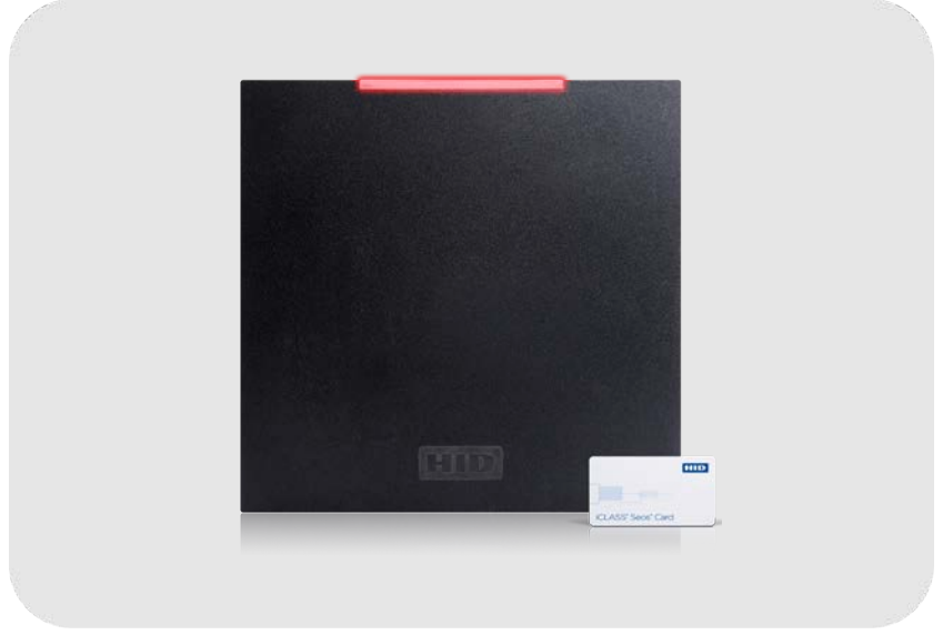
ASSA ABLOY HID R90 iCLASS SE™ RFID Okuyucu 13,56 Mhz